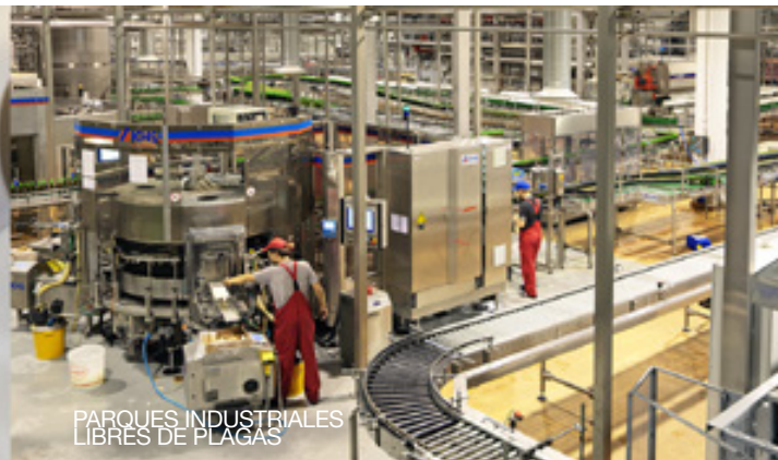
PARQUES INDUSTRIALES LIBRES DE PLAGAS